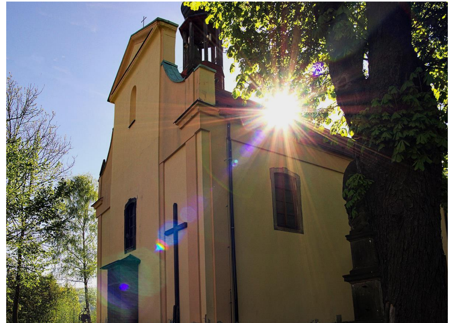
St. Michaelskirche in Brandau in der Morgensonne

Wer recht die Pfingsten feiern will, der wird in seinen Herzen still. Ruh', Friede, Lieb' und Einigkeit sind Zeichen solcher edlen Zeit, darin der heil'ge Geist regiert. Der ist es, der zur Andacht führt; er kann kein groß Getümmel leiden; wer jenes liebt, muss dieses meiden, und Gott allein gehorsam sein. (Ernst Lange, 1650 – 1727)